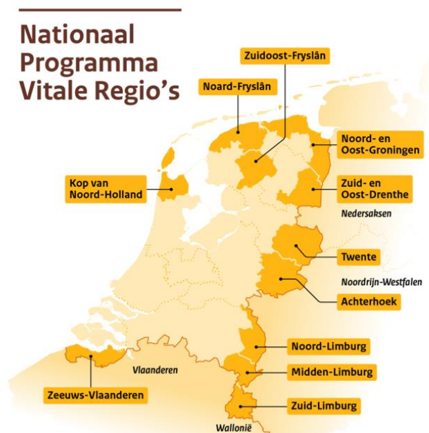
Figuur 3. Illustratief kaartbeeld van het Ministerie van Binnenlandse Zaken en Koninkrijksrelaties.

gemeenschappen, gemeenschappen die elkaar begrijpen, dezelfde taal spreken, zal er veel minder snel sprake zijn van gesprekken waar dissociatief taalgebruik optreedt (CAOP, 2023)