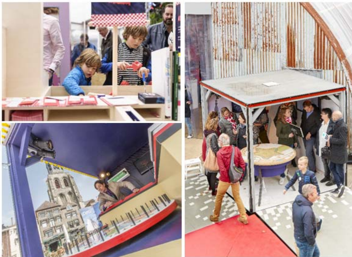
Sfeerbeelden van de instrumenten (foto's provincie Noord-Brabant)

Een andere vorm van participatie die we gebruikten, was een online research community . Hierbij hebben we tweemaal gedurende twee weken gesproken met in totaal 70 Brabanders. De community ontmoette elkaar online op een afgeschermd forum, waarop de deelnemers vragen of polls konden beantwoorden, met elkaar in gesprek konden gaan, maar ook bijvoorbeeld foto's van mooie plekken konden delen. De discussie werd begeleid door onderzoekers.