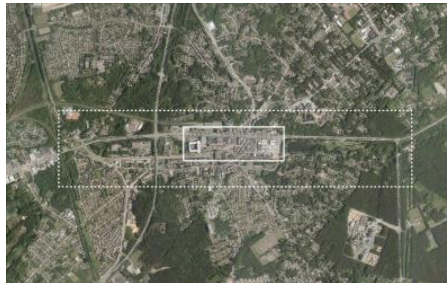
Stadscentrum en stationsomgeving (OO2902 Vlaamse Bouwmeester)

Deze vijf pijlers vormen samen de dragende structuur waarop het centrum van Genk in relatie tot de radars verder gebouwd wordt. De stedelijke strip aan de westkant van het centrum (Genk-West), bijvoorbeeld, bevindt zich op een kantelpunt: de komende jaren zal het gebied fundamenteel transformeren, onder meer door verhuisbewegingen van publieke functies, herbestemming van industriële sites en de verweving van economie, landschap en identiteit. In die transformatie staat weerbaarheid centraal, niet enkel als ecologisch principe, maar als integraal stedelijk vermogen om om te gaan met verandering, onzekerheid en complexiteit.